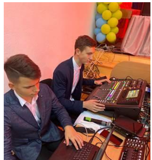
Оновлення звукової апаратури в актовій залі ВЛ №6