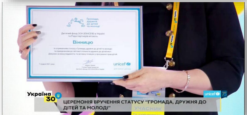
Україна 30 ЦЕРЕМОНІЯ ВРУЧЕННЯ СТАТУСУ «ГРОМАДА, ДРУЖНЯ ДО ДІТЕЙ ТА МОЛОДІ» УЧАСНИК

Підвищено рівень доступності до послуг дошкільної освіти для дітей з різних мікрорайонів громади шляхом створення нових місць у закладах дошкільної освіти. У 2021 році додатково відкрито групу на 20 місць у ЗДО №16 та введено в експлуатацію два нових дитячих садки у місті Вінниці (110 місць) та селі