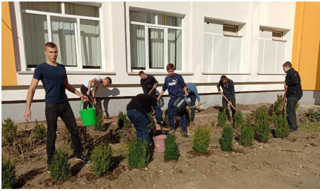
Зелена огорожа у ВЛ №10