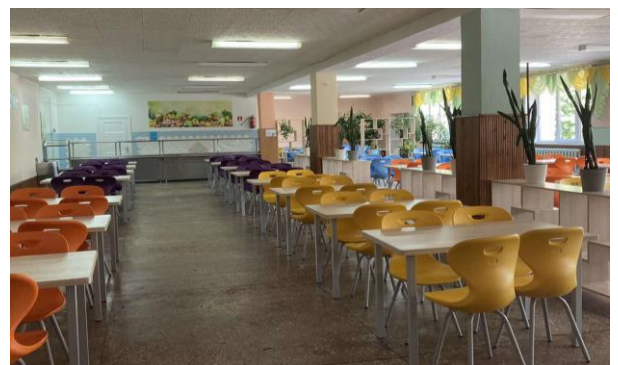
Оновлена їдальня у ВЛ №16