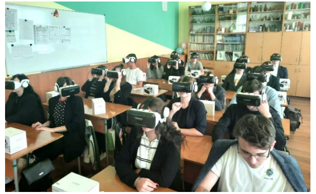
Екоосвіта в окулярах віртуальної реальності у ВЛ